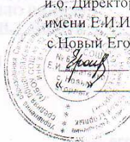
График подвоза обучающихся МБОУ СОШ № 62 имени Е.И.Игнатенко с. Новый Егорлык

По маршруту № 1 «Школа- ул.Кооперативная -школа»