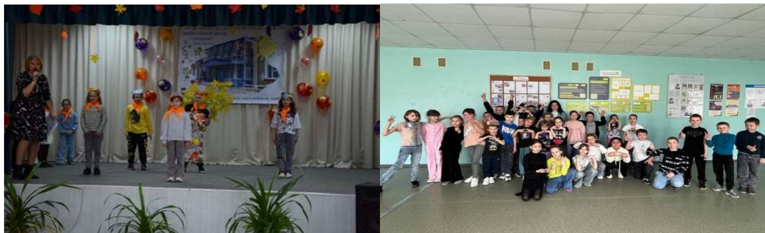
- лагерь с дневным пребыванием детей «Солнышко».