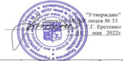
Календарный учебный график МОБУ лицея № 33 на 2022-2023 учебный год